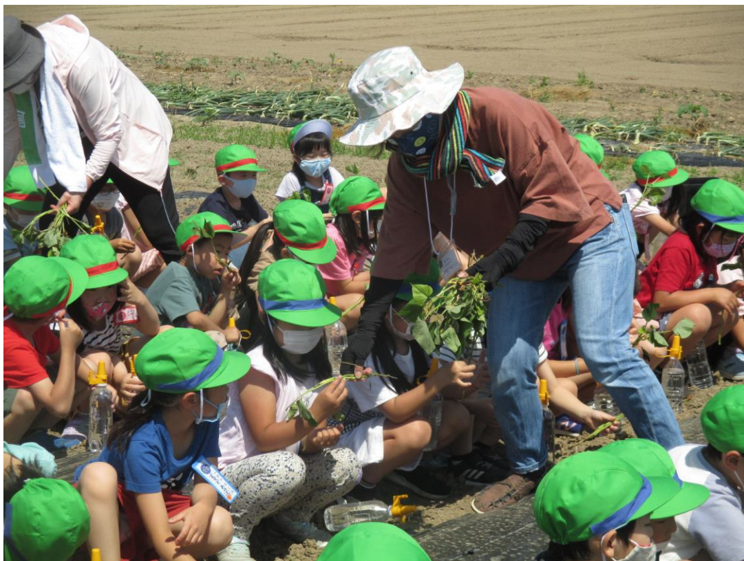
学童農園での作業の様子