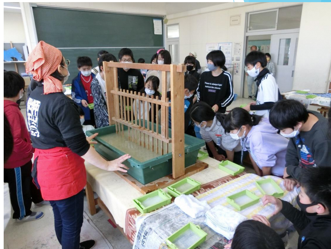
柳生和紙づくり体験の様子