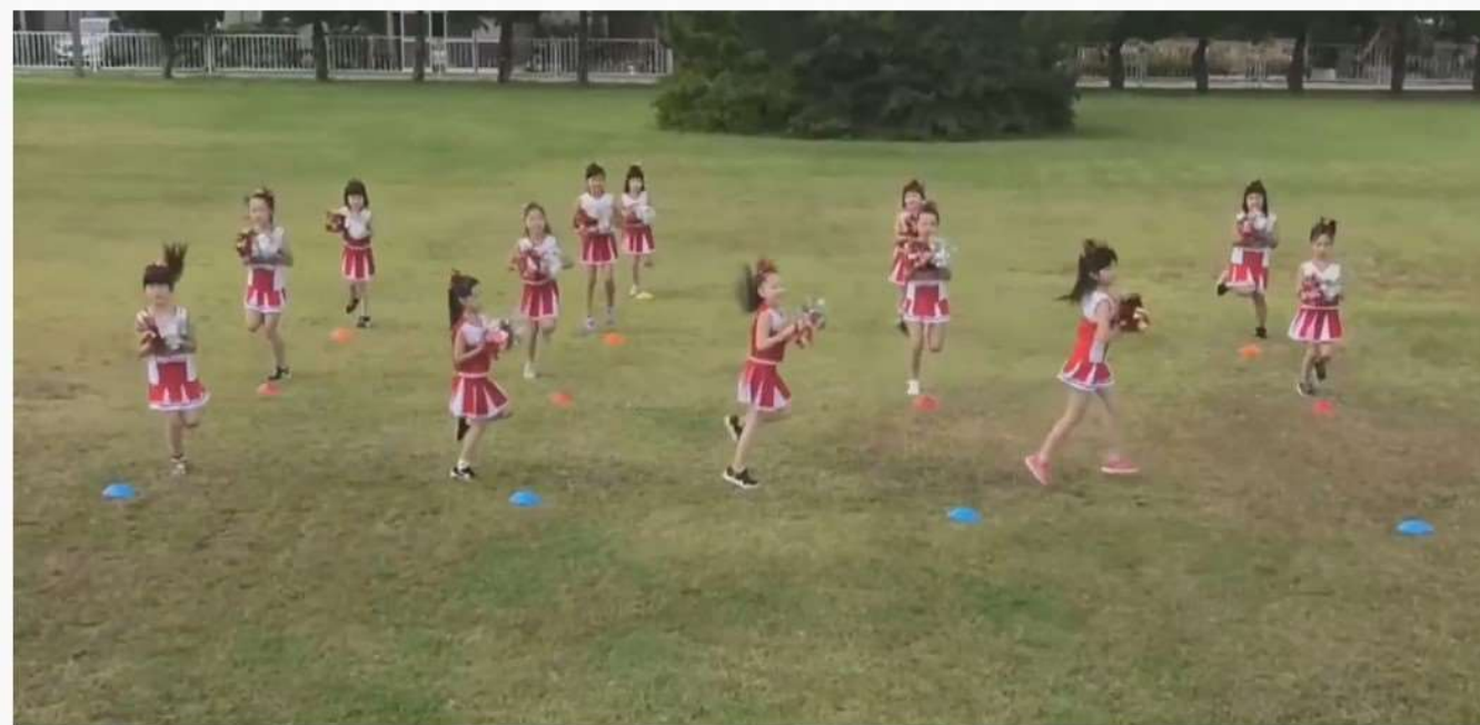
ジャングルキッズスポーツ少年団 mickey