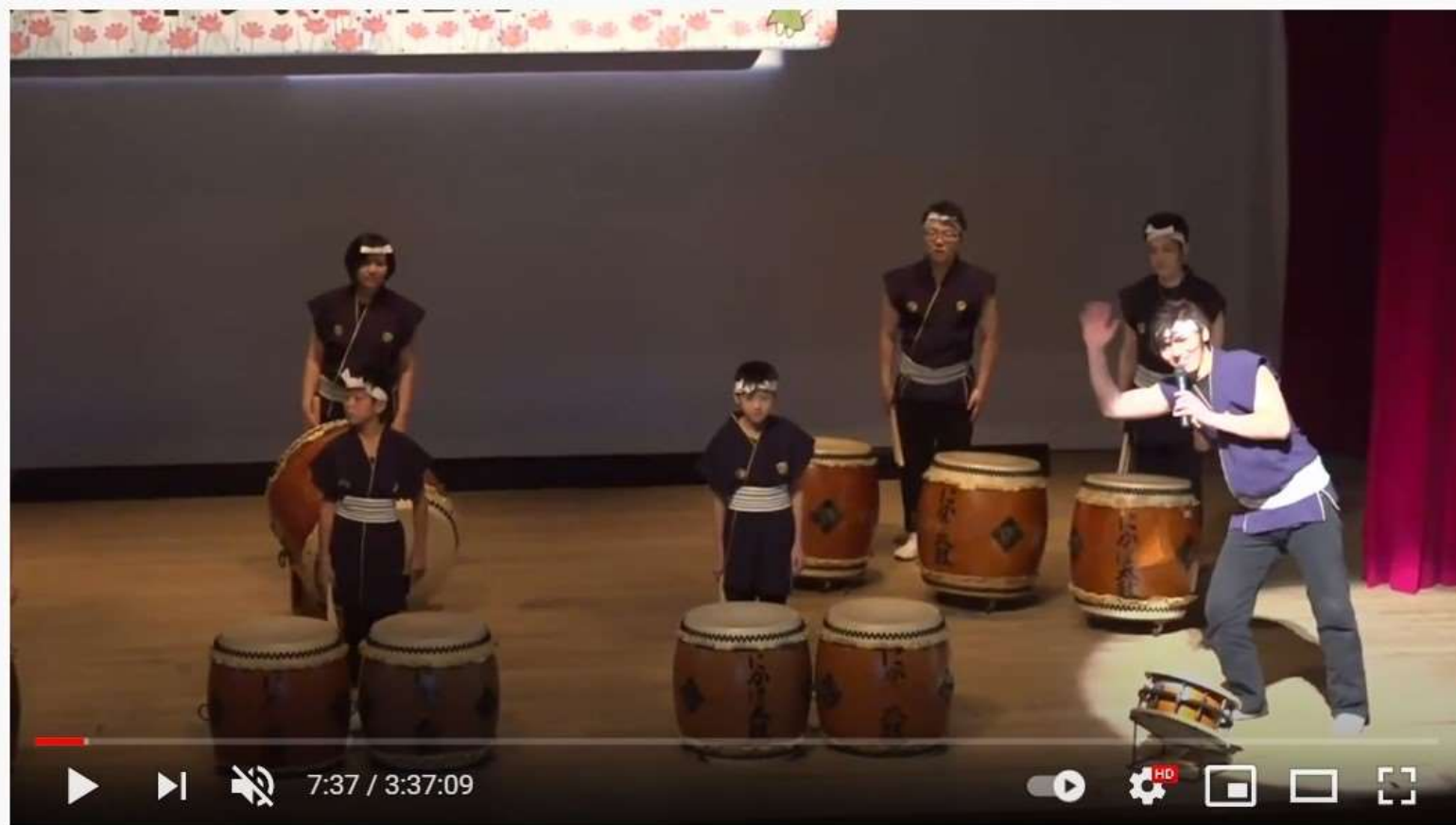
にかほ市民文化祭2020音楽・芸能祭11/1