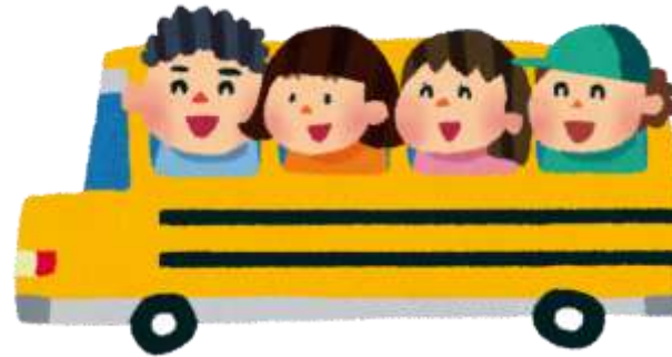
家⇔学校（スクールバス）