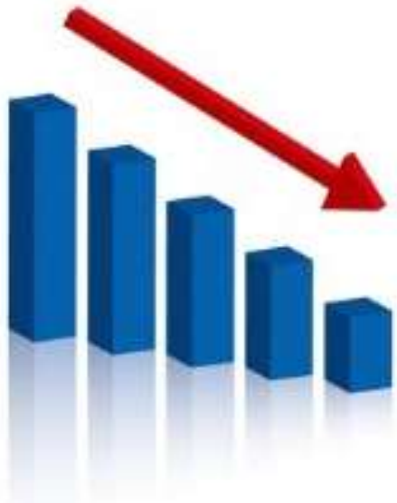
人口減少・少子高齢化