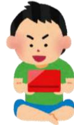
友達とはオンラインで

子ども達の生活スタイルは都市部と変わらない。 そして高校進学と同時に地域を離れなければならない。